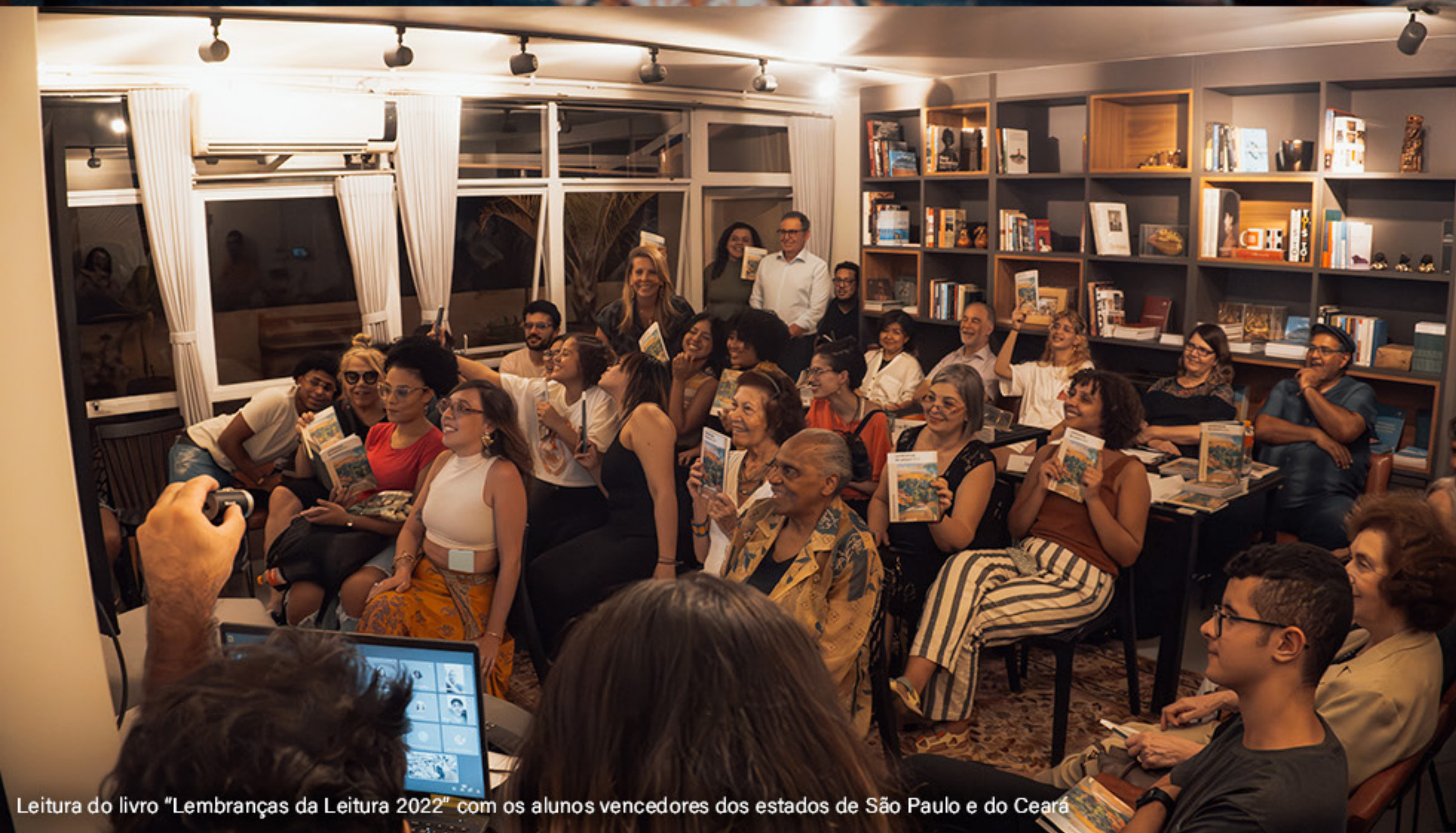
Leitura do livro "Lembranças da Leitura 2022" com os alunos vencedores dos estados de São Paulo e do Ceará