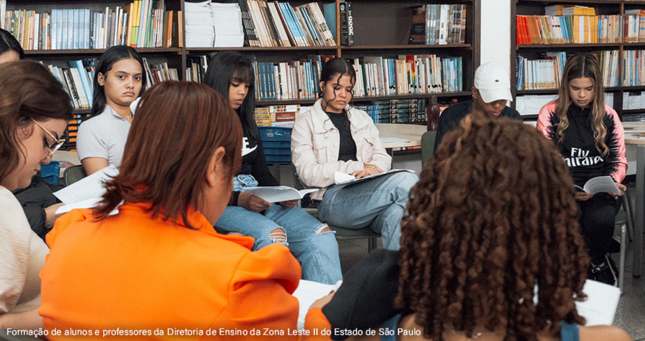
Formação de alunos e professores da Diretoria de Ensino da Zona Leste II do Estado de São Paulo