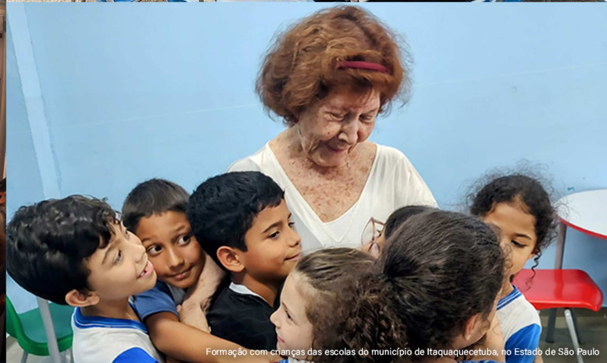
Formação com crianças das escolas do município de Itaquaquecetuba, no Estado de São Paulo