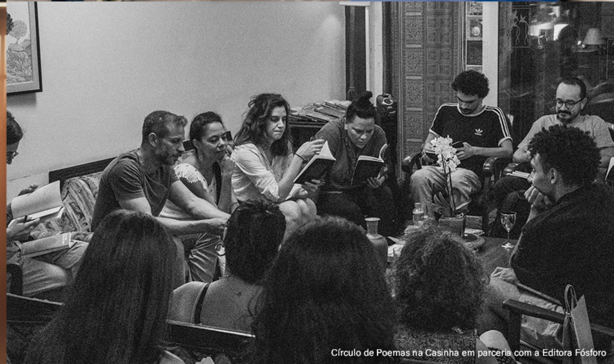
Círculo de Poemas na Casinha em parceria com a Editora Fósforo