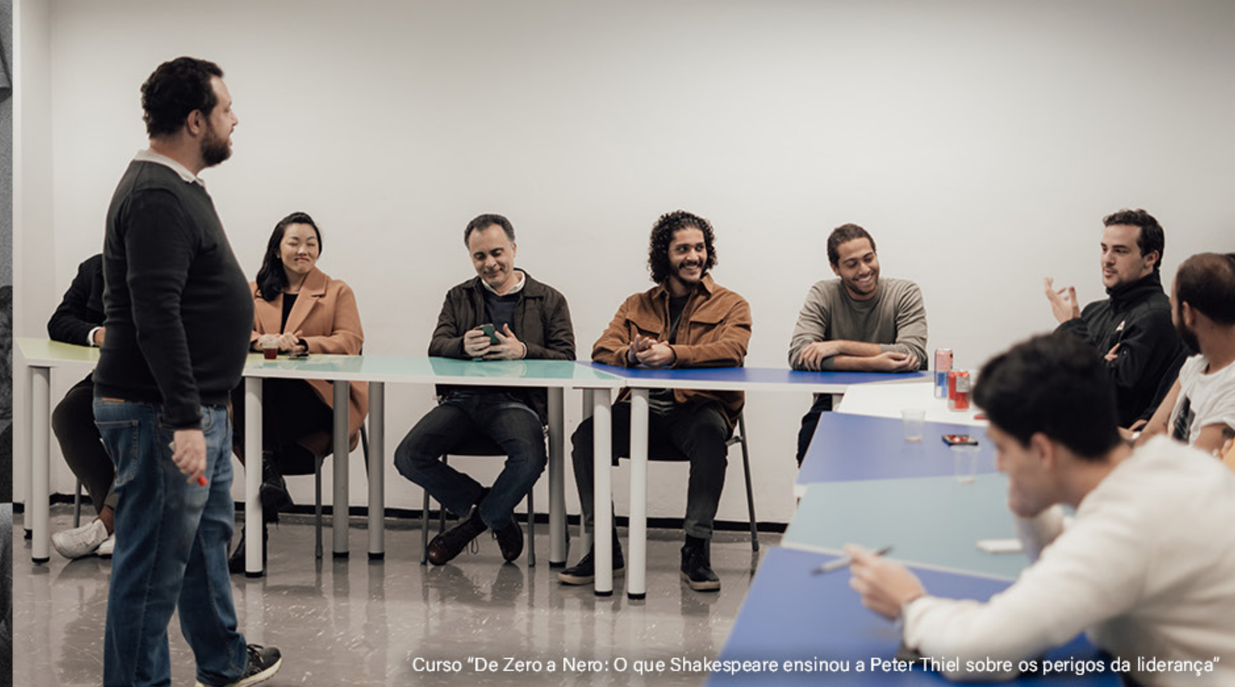
Curso "De Zero a Nero: O que Shakespeare ensinou a Peter Thiel sobre os perigos da liderança"