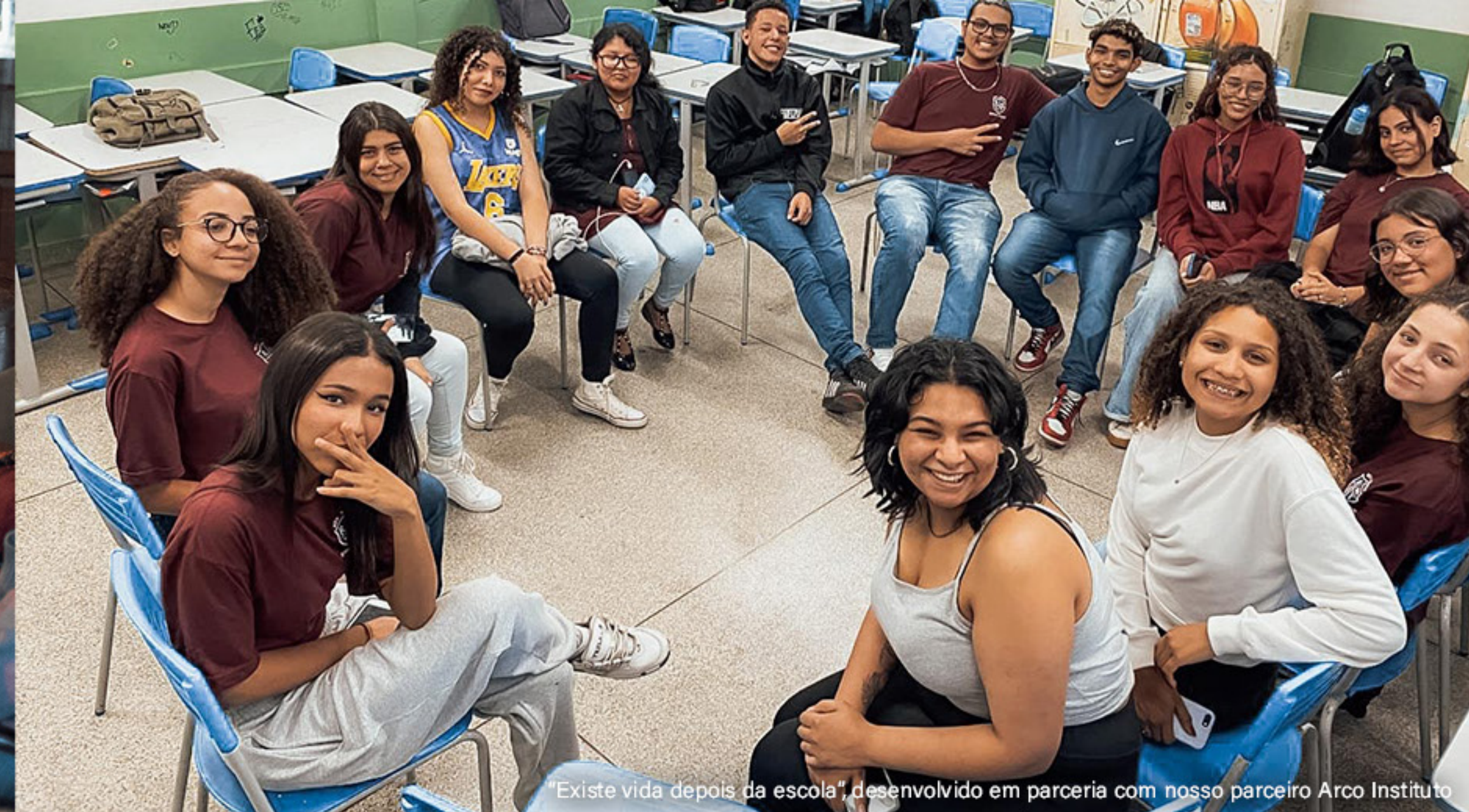
"Existe vida depois da escola" desenvolvido em parceria com nosso parceiro Arco Instituto