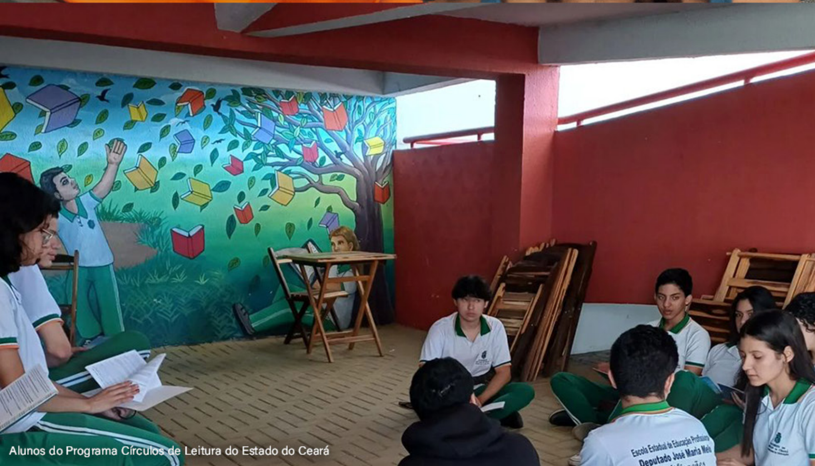
Alunos do Programa Círculos de Leitura do Estado do Ceará