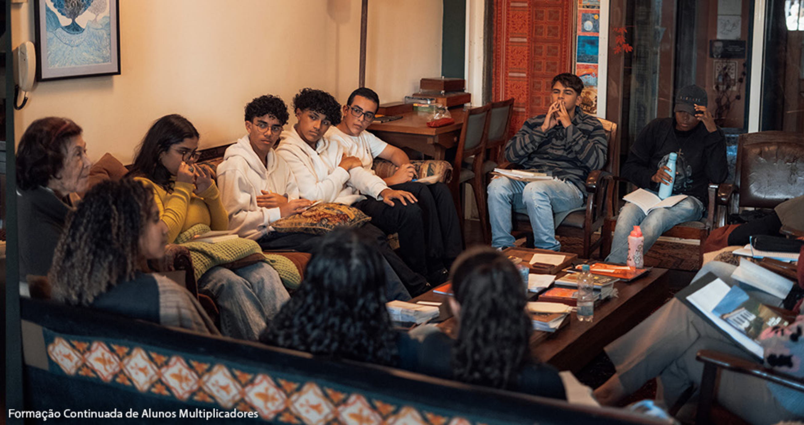
Formação Continuada de Alunos Multiplicadores