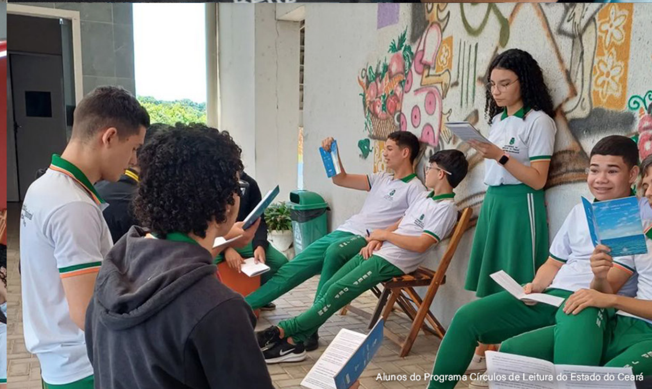
Alunos do Programa Círculos de Leitura do Estado do Ceará