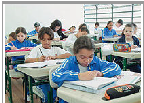
DEVER Alunos de uma escola municipal em São Paulo. A meta é levar o ensino ao nível dos países desenvolvidos até 2022